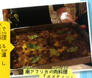
南アフリカの肉料理「ボボティー」

こんげつ がっこうきょうしき 今月の学校給食では、南アフリカ料理が出るよ！いつ出るかは学校によって違うので、チェックしてみよう！